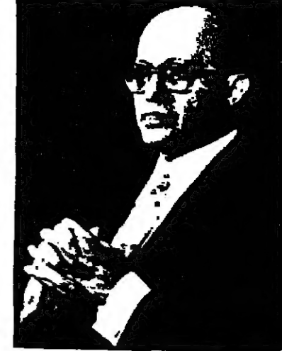
انتخاب عربيين من الناصرة لعضوية النقاب القطرية لوفتي الدولة

لقد كنت من قبل مدير ديوان رئيس الحكومة السيد يحييل قديسي بالردي على رسالتكم الرقيقة التي بعثت بها الي السيد رئيس الحكومة بالشكر والتقدير لما جاء فيها من تبرك ونعمات له ومن تقدير لمساعي الحكومة وموظفيها لانجاح وتسهيل سفر الحجاج المسلمين من اسرائيل الى الديار الحجازية المقدسة . فالحكومة لا تبالغ في اجراءها لانجاح لكل مواطن من القيام بكل ما يتوجب عليه نحو ربه ودينه .